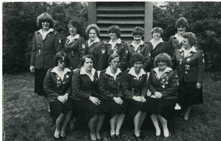
Aus unserer heutigen Vereinsarbeit nicht mehr wegzudenken: Die 1975 gegründete Frauengruppe des BSV Alt-Herne 1908 e. V.