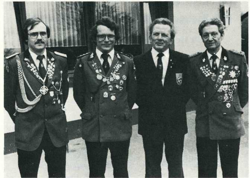
Der Offiziers-Ausschuß des BSV Alt-Herne 1908 e.V.